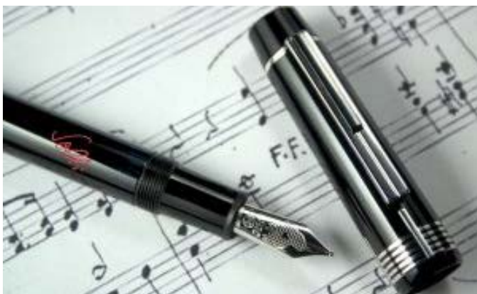
Obras artísticas, como la música, están amparadas por los derechos de autor y conexos.